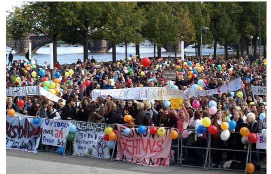
Die Demonstration vor dem Sächsischen Landtag für den Erhalt der Freien Schulen in Sachsen stand unter dem Motto „Damit's bunt bleibt“.

Das Positionspapier der SPD-Fraktion „Damit's bunt bleibt. Die SPD sagt Ja zu freien Schulen“ finden Sie unter www.hanka-kliese.de .