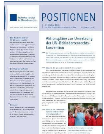
Die Publikation „Positionen“ informiert über die Umsetzung der UN-Behindertenrechtskonvention und kann im Bürgerbüro abgeholt werden.

Aufgrund der spärlichen Bemühungen der Sächsischen Staatsregierung zur Umsetzung der UN-Behindertenrechtskonvention setzte die SPD-Fraktion das Thema erneut auf die Tagesordnung. Im Mittelpunkt standen die Antworten der Staatsregierung auf die Große Anfrage der SPD-Fraktion, aus denen hervorgeht, dass es weder einen Aktionsplan zur Umsetzung der Konvention noch Pläne für einen solchen Plan gibt. Sowohl Elke Herrmann (Bündnis 90/Die Grünen) als auch Hanka Kliese verwiesen nachdrücklich auf den rechtlich bindenden Charakter der UN-Konvention, die den Rang eines Bundesgesetzes besitzt. Der Abgeordnete Horst Wehner (Die Linke) forderte versöhnlich zu gemeinsamem Handeln auf, während die Debatte sonst mit gewisser Schärfe geführt wurde. Die Beiträge der CDU machten deutlich, dass von den Regierungsparteien nach wie vor wenig Handlungsbedarf gesehen wird. Wo „Sonderschulen als Teil von Inklusion“, so der behindertenpolitische Sprecher der CDU Gernot Krasselt, betrachtet werden oder Arbeitsmarktpolitik die Sanierung von Werkstätten für Menschen mit Behinderung bedeutet, ist die Welt noch in Ordnung. Weniger zufrieden mit der Arbeit der Staatsregierung als sie selbst dürfte die Monitoring-Stelle des Deutschen Institutes für Menschenrechte sein. Diese betonte noch in ihrer letzten Publikation „Positionen“, wie wichtig es sei, Aktionspläne zu erarbeiten, und zeigte sich mehr als erstaunt darüber, dass Sachsen einen solchen Aktionsplan rundweg ablehnt.