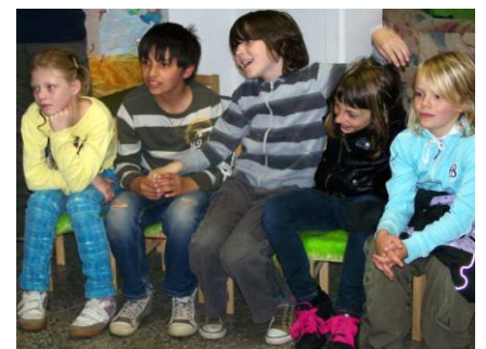
Fröhliche Stimmung beim Kiwi-Geburtstag

Der Kinder- und Jugendfreizeitclub „Kiwi“ auf dem Sonnenberg feierte am 4. Mai seinen dritten Geburtstag. Im „Kiwi“ werden Hausaufgaben erledigt, Spiele ausprobiert, es gibt eine Essensversorgung und eine Vielzahl von außerschulischen Bildungsangeboten. Das in Chemnitz einmalige Projekt trägt sich selbst, durch die Unterstützung von vielen helfenden Händen; etwa dem Rotary-Club, der GGG (die kostenlos die Räume zur Verfügung stellt) und natürlich den ehrenamtlichen MitarbeiterInnen. Zur Geburtstagsfeier spielte die multikulturell geprägte Theater-Gruppe der Georg-Weerth-Mittelschule eine besonders humorvolle Version des russischen Märchens der „Hexe Babajaga“ und erzeugte damit eine fröhliche ausgelassene Stimmung. Wir wünschen dem Kiwi und allen, die dazu beitragen, dass es ihn gibt, Energie und Erfolg für die kommende Arbeit und noch viele, viele weitere schöne Geburtstage.