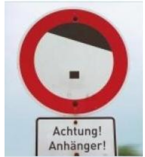
Solche Anhänger gibt es leider auch im Landtag