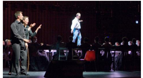
Gebärdensprachdolmetscher am linken Rand der Bühne übersetzen das Stück für Gehörlose