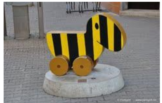
Auch eine Sehenswürdigkeit in Erfurt: Die Tigerente

Zur Sprecherkonferenz kamen am 2. und 3. Mai die SPD-Tourismuspolitiker von Schleswig-Holstein bis Bayern nach Erfurt, um sich über aktuelle Themen austauschen. Zunächst führten Vertreter des sozialdemokratisch geführten Thüringer Wirtschaftsministerium aus, welche Ziele sich die Regierung für die kommenden Jahre für den Tourismus gesteckt hat: weg von der alten Dachmarke, hin zur Vermarktung einzelner Destinationen unter angehobenen Anforderungen und das Herstellen einer stärkeren Verbindung von touristischen Anziehungspunkten wie Weimar zu ihrem Bundesland. Als Grundlage für die neue Tourismusstrategie in Thüringen dienen umfassende Datenerhebungen zum Tourismus und seiner Vermarktung. Weitere Themen waren die Umsetzung eines barrierefreien Tourismus, Wasser- und Schienenverkehr und Tourismus sowie die Frage nach der Erhebung von Kulturabgaben, Kurtaxen oder Fremdenverkehrsabgaben. Der fachliche Blick über den sprichwörtlichen Tellerrand bereicherte die Teilnehmer ebenso wie das Rahmenprogramm in der wunderschönen Stadt Erfurt. Die Besichtigung der Alten Synagoge, welche Bauteile aus dem 11. Jahrhundert beherbergt und somit die älteste so erhaltene Synagoge Mitteleuropas ist, hinterließ einen tiefen Eindruck. Für die Organisation gilt der SPD-Landtagsfraktion Thüringen und ihren Referenten an dieser Stelle ein besonders herzlicher Dank.