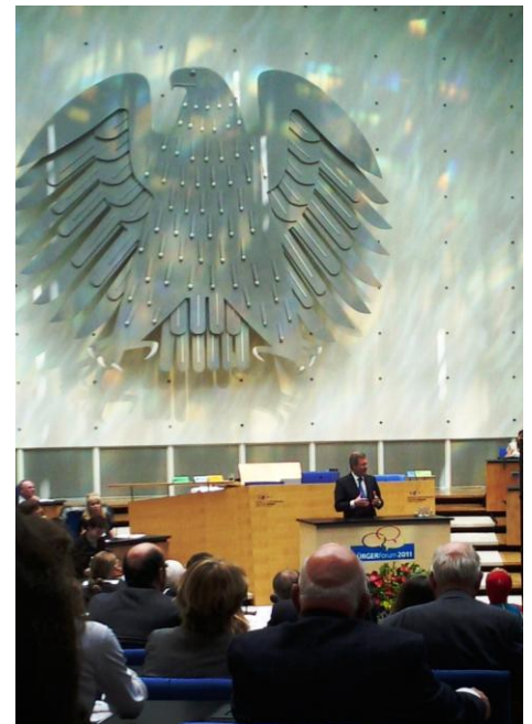
Bundespräsident Christian Wulff spricht im ehemaligen Bundestag in Bonn zu den TeilnehmerInnen des BürgerForums