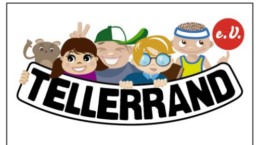
Ein sachliches und ein kindgerechtes Logo symbolisieren zukünftig den Verein