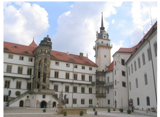
Innenhof des Schloss' Hartenfels in Torgau – nur eine von vielen touristischen Attraktionen in der Stadt und der Umgebung (Quelle: www.wikimedia.de ).

Die anschließende Diskussion ging dann über das Thema Tourismus hinaus. So interessierten sich die GenossInnen dafür, mit welchen Themen die SPD-Landtagsfraktion gedenkt in den nächsten Landtagswahlkampf zu ziehen, wie das Verhältnis zur Partei DIE LINKE bewertet und welche Kosten der Umzug der sächsischen Behörden verschlingen wird.