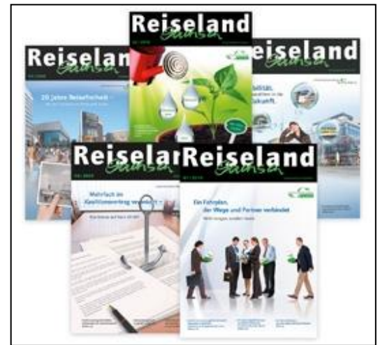
Auch der Landestourismusverband beschäftigt sich u.a. in seiner Verbandszeitschrift mit dem Thema (Quelle: www.reiseland-sachsen.de )