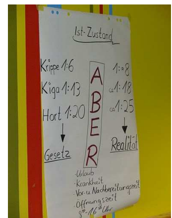
Darstellung des Ist-Zustandes des Betreuungsschlüssels in der Kita Flohzirkus in Wittgendorf