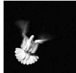
Das Motiv des Aufrufs des Bürgerbüros „politik.offen“.

Wer sich bei diesem Aufruf angesprochen fühlt, ist herzlich eingeladen, am 5.3. die verschiedenen Akteure des Bündnisses an ihren Ständen rund um den Rosenplatz und die Bernsdorfer Straße zu besuchen.