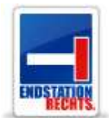
Organisatoren des Seminars sind die Friedrich-Ebert-Stiftung sowie Endstation.RECHTS